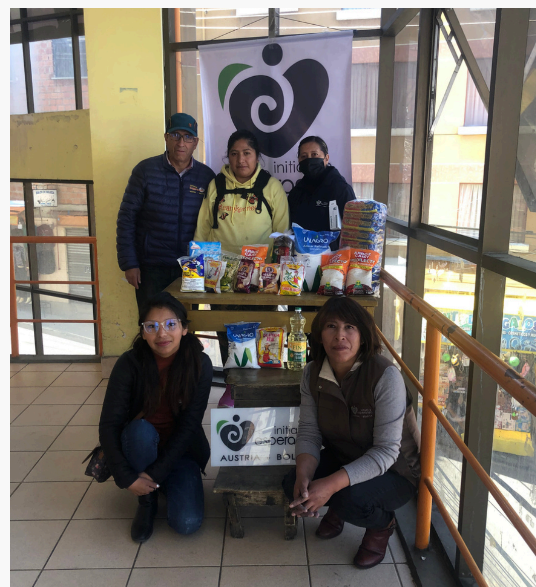
Im Rahmen unseres Familienprojektes unterstützen wir monatlich mit 40 Euro in Form von Lebensmitteln, Hausrat, Medikamenten uvm.