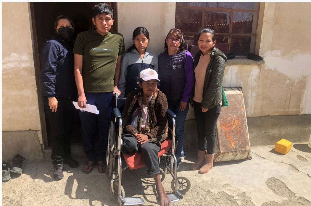
Unser Team begleitet alleinerziehende Mütter und ihre Kinder in La Paz und El Alto mit sozialer, psychologischer und pädagogischer Hilfe.

Es gäbe von vielen Dankesworten zu berichten. Das Schönste für uns ist es, ihre glücklichen Gesichter und strahlenden Augen zu sehen, wenn sie ihre Lebensmittelpakete, ihr überlebensnotwendiges Medikament oder das Abschlusszeugnis ihrer Kinder in Händen halten. All dieses Strahlen und diese Freude der dankbaren Mütter und Kinder verdanken wir Ihrem großen Herzen. Die Familien können oft nicht glauben, dass es so selbstlose Frauen und Männer gibt. Menschen, die tausende Kilometer entfernt leben und sich um andere – ohne sie zu kennen – wie um Familienmitglieder sorgen und kümmern.